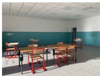
Classes 4 nouvelles salles