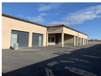
Vue extérieure Entrée principale