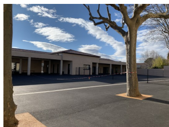
Vue intérieure Cour récréation et préaux